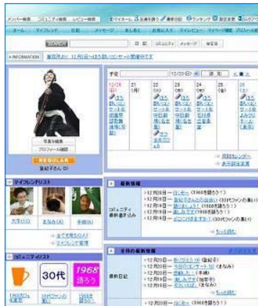
・ マイページ画面